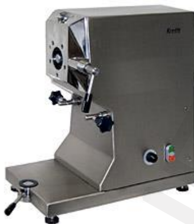
Pogonska enota KU 1105