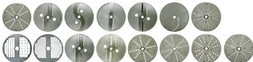
Na razpolago številni rezalni diski, tudi za kockasto rezanje

Nemška kvaliteta! Odlična zamenjava za dražji stroj Feuma HU 1020!