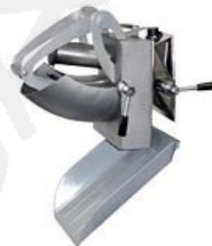
Nastavek za rezanje zelenjave s številnimi rezalnimi, sekljalnimi in ribalnimi diski za zelenjavo in sadje za pripravo na kolobarje, trakove in kocke (opcija)