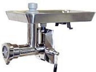
Nastavek za mletje mesa (opcija) s kapaciteto do 400 kg/h