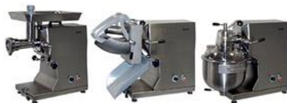
Trije stroji v enem, zahvaljujoč različnim nastavkom (mesoreznica, rezalec zelenjave in planetarni mešalec)

Univerzalni kuhinjski stroj KU 1105 Krefft združuje tri aparate v enem, in sicer rezalnik zelenjave, mesoreznico in planetarni mešalec. Inox kotliček ima 15,5 litrov prostornine. Lahko se dobavijo tudi dodatni nastavki za mletje mesa z različnimi noži ali pa nastavek za rezanje zelenjave z različnimi rezalnimi diski. Stroj predstavlja izredno dobro zamenjavo za veliko dražji univerzalni stroj Feuma HU 1020. Pogonska enota se lahko postavi na mizo ali montira na stojalo s kolesi. Nastavki in noži so izdelani iz visoko kvalitetnega inoxa. Priklop stroja na 230V, moč 550W, dim. 600x330xh540mm.