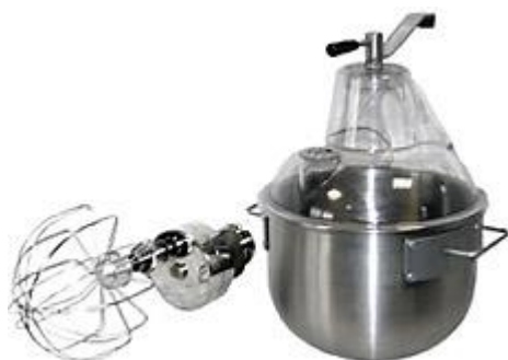
Nastavek za mešanje testa s 15,5 litrskim inox kotličkom (opcija)

Univerzalni stroj KU 1105 Krefft Dim.600x330xh540mm Nastavek mešalna glava (opcija) Nastavek mesoreznica (opcija) Nastavek rezalec zelenjave (opcija) Napetost 230V Moč 550W Teža 45kg