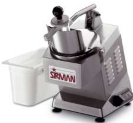
Rezalnik zelenjave Sirman

Rezalnik zelenjave Inox izvedba Kapaciteta 200kg/h Dim: 225x510xh770mm Napetost: 230V/400V Moč: 515W Št. obratov: 300rpm Velika izhodna odprtina Številni rezalni diski (opcija)