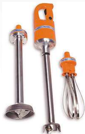
Palični mešalnik Dynamic s tremi nastavki

Palični mešalnik MFAP2000 3 nastavki Primeren za delo v kotlu Mikser: 430mm Metlica: 250mm Nastavek za piriranje: 430mm Moč: 460W Št.obratov: od 3000 do 9000 (mikser) Za 100lit. kapacitete