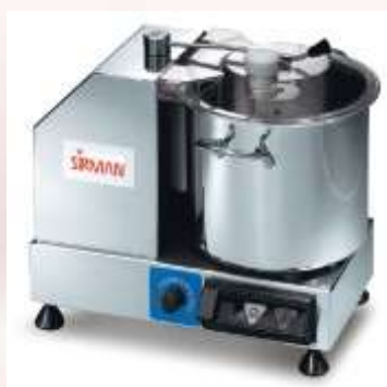
Kuter Sirman z variabilno hitrostjo

Sekljalniki zelenjave Sirman C6VV Kapaciteta posode 6 litrov Dim: 380x320xh320mm Napetost: 230V Moč: 350W Obrati od 1500rpm do 2800rpm