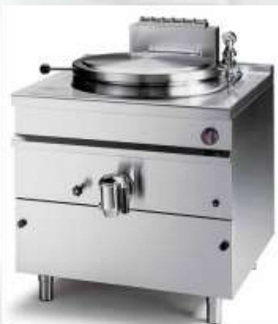
Okrogli kotel 150 lit. Firex

S kotli Firex lahko pripravite živila na hiter in enostaven način brez oprijemanja, zahvaljujoč indirektnemu gretju in duplikatorju posode. Posoda je izdelana iz inoxa AISI 316, pokrov posode, zunanji plašč in ogrodje pa v inoxu AISI 304. Lahko se naroči el. ali pl. izvedba. Kotli imajo termostatsko regulacijo od 0°C do 105°C in elektronski vžig plina. Volumen od 50lit. do 500lit.