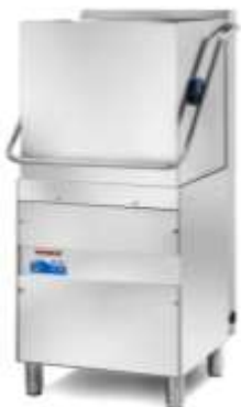
Pretočni pomivalni stroj Kromo z vhodno in izhodno mizo