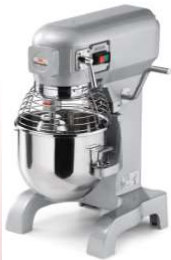
Planetarni mešalec Sirman z 20 litrskim kotličkom

Univerzalni kuhinjski stroj Feuma HU1020 Za gnetenje mas kotliček 40 litrov Za rezanje ribanje in strganje zelenjave Za mletje mesa 2 hitrosti delovanja Moč 1,9kW Napetost 400V