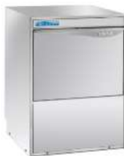
Podpulni pomivalni stroj Kromo