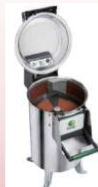
Lupilec krompirja Fimar

Lupilci krompirja PPN18 Fimar Urna kapaciteta 220kg Posamično polnjenje 18kg Timer do 4 minute Moč 1,1kW Napetost 400V