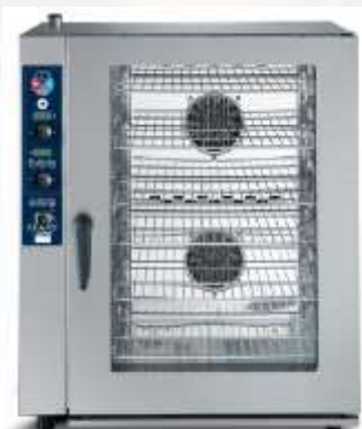
Parnokonvekcijska peč Lainox, 10 pekačev z digitalnimi komandami

avtomatsko z zagonom prednastavljanih programov možnost izbire 99 lastnih shranjenih receptov časovno omejeno ali s pomočjo sonde kontinuirano neprekinjeno delovanje