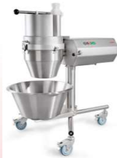
Feuma HU 1020 pogonski stroj s podstavkom in posodo na kolesih in nastavkom za rezanje zelenjave

Planetarni mešalec za testo Sirman Volumen kotlička 20litrov 420x560xh770mm V kompletu 3 mešalni nastavki 3 hitrosti delovanja Moč 1100W Napetost 230V