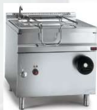
Prekucna ponev 120 lit. Firex

Prekucne ponve se lahko dobavijo v električni ali plinski izvedbi. Posoda je izdelana iz inox AISI 304 materiala v »compound« sistemu, ki omogoča učinkovitejšo porazdelitev toplote. Ponve lahko imajo mehanski ali električni pomik posode. Temperatura priprave živil lahko poteka med 50-300°C. Volumen od 50lit do 200lit.